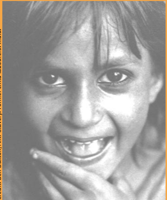
Former child labourers. India.

La OIT estima que existen alrededor de 250 millones de niños y niñas entre los cinco y los catorce años de edad trabajando en todo el mundo , y de ellos, 120 millones trabajan una jornada completa. Se calcula que 80 millones trabajan en las peores formas de trabajo infantil. La gran mayoría de estos niños y niñas trabaja en actividades agrícolas , y el mayor empleador individual de niñas es el trabajo doméstico . Alrededor del 70% de los niños y niñas que trabajan desempeñan trabajos no remunerados para sus familias, bien sea en el hogar o en pequeñas empresas, en áreas rurales o urbanas .