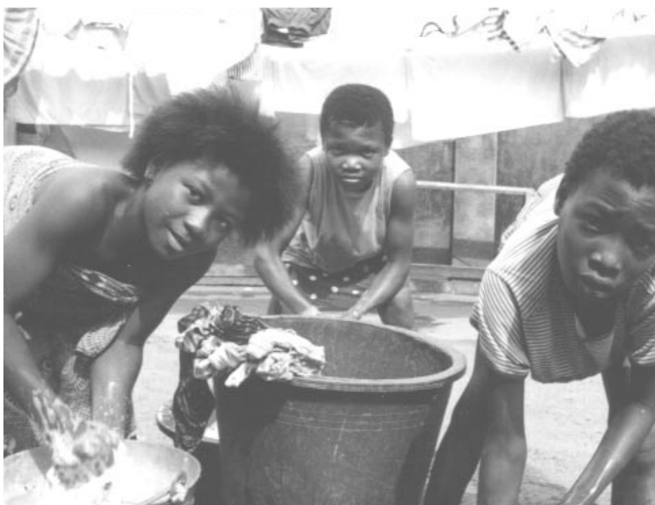
Child domestic workers. Benin.

Finalmente, la idea de un parlamento de la infancia para promover y discutir tales cuestiones ha sido acogida en Togo. La Asamblea Nacional de Togo actualmente (Setiembre 2000) está eligiendo niños/as a nivel regional, y ellos participarán en el futuro Parlamento de la Infancia!