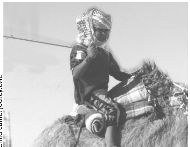
Child camel jockey,UAE