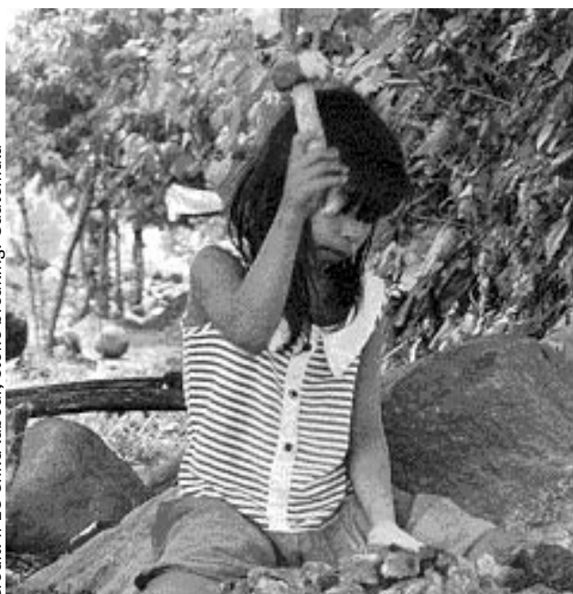
Child labour, stone breaking. Guatemala

La labor de 500 niños y niñas que trituran roca en Retalhuleu, Guatemala, es definitivamente una de las peores formas de trabajo infantil.