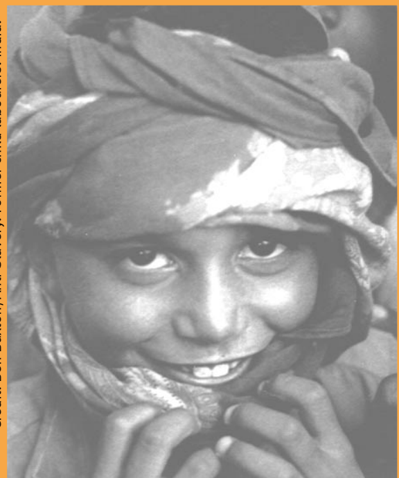
Former child labourers. India.