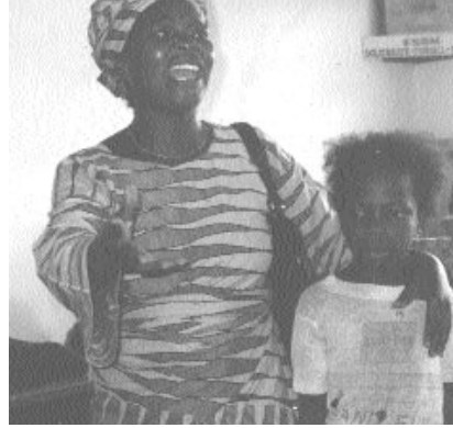
Play depicting trafficking of children for domestic work, Benin.

لقد صدقت الحكومة في توغو الاتفاقية رقم 182 في ايلول (سبتمبر) 2000. صادف تطبيق الاتفاقية صعوبات كثيرة في توغو مما استدعى جهد مكثف وردود مختلفة من جميع الذين يعملون على محاربة ووقف أسوأ اشكال عمل الأطفال في توغو. وكان من الضروري التوصل الى اتحادات بين الشركاء على المستوى المحلي والاقليمي الوطني. ومن حسن الحظ ان الاتفاق يعتبر نقطة انطلاق وورقة رابحة في يد المشتركين في هذه الحملة.