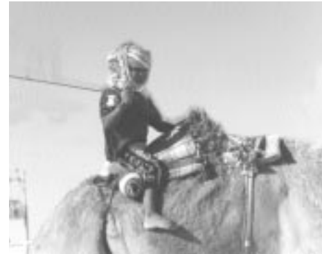
FAO, 'Back to Learning' Child Care, 'Back to Learning' Child Care

كيف يمكن للمجتمع المدني الاستفادة من اتفاقية 182 وتوصية 190 - المشاركة في برامج العمل الوطنية.