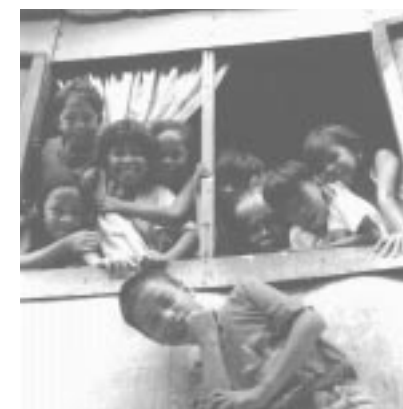
Children posing for the camera.