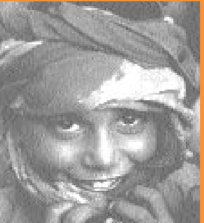
Former child labourers.