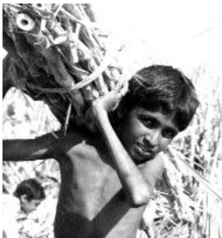
Child agricultural labour. Pakistan.

◀ يحقّ شرعياً لمن زاد عمره عن السادسة عشر ان يمارس عملاً خطراً، شرط ان يكون محمياً من اي تهديد قد يسببه العمل وشرط ان يتم تدريبه بشكل ملائم للقيام بهذا النشاط. أما التفويض الذي يسمح بهذا العمل فيجب أن يتفق عليه بالمشاركة بين منظمات العمل وأصحاب العمل.