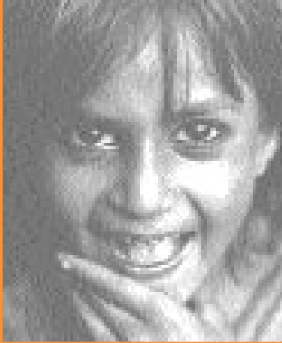
Former child labourers.